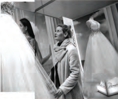
Γ. ΤΣΙΛΙΑΝΑ - ΗΜΕΡΗΣΙΑ ΕΚΔΟΣΗ

Όλο και περισσότεροι ελληνικοί προορισμοί διεκδικούν ένα κομμάτι από τη διεθνή αγορά γάμων με φόντο εδύλλιακά αγαιοπελαγίτικα τοπία.