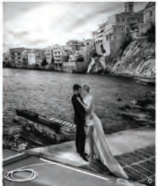
Η φωτογραφία-ομίση, το νυφάκι σε σχήμα καρδιάς στον κύκλο του Νεσφιού Ηόρου μοιάζει με το ιδανικό «γεωγραφικό δώρο» για το νύφο του Αργολικού.

Όσον αφορά την ελληνική αγορά, η γυναίκα πλέον είναι πιο ανεξάρτητη, πιο εργαζομένη, πιο υπεύθυνη και πιο απαιτητική. Η κοινωνία έχει αλλάξει και η γυναίκα έχει αλλάξει. Η γυναίκα πλέον είναι πιο ανεξάρτητη, πιο εργαζομένη, πιο υπεύθυνη και πιο απαιτητική. Η κοινωνία έχει αλλάξει και η γυναίκα έχει αλλάξει.